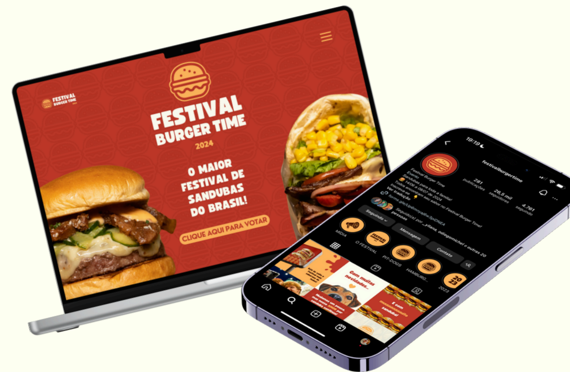
Site e Redes Sociais